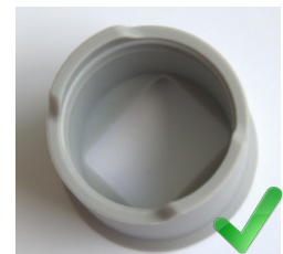
EMBOUT NEUF Aspect interne et externe gris et mat