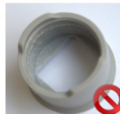
PUNTA DAÑADA apariciencia interna y gris exterior y mate

TIEMPO DE VIDA VERIFICADO PARA 100 PASES DE CICLOS DE AUTOCLAVE.