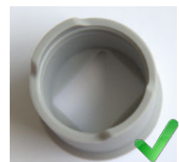
EMBOUT NEUF Aspect interne et extérieur gris et mat