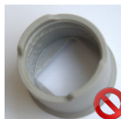
EMBOUT ENDOMMAGÉ Aspect interne et/ou externe brillant et collant

DURÉE DE VIE VÉRIFIÉE POUR 100 PASSAGES DE CYCLE DE STÉRILISATION À L'AUTOCLAVE.